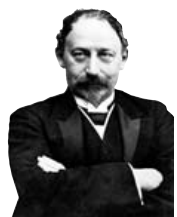
EDVARD BRANDES (1847-1931) STIFTER AF POLITIKEN I 1884