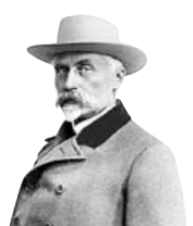
VIGGO HØRUP (1841-1902) STIFTER AF POLITIKEN I 1884

Kronikforslag på ca. 2.100 ord sendes med navn, titel og post-adresse til Kronikredaktionen. Indlæg kan sendes som mail til kronik@pol.dk På politiken.dk/leder kan man kommentere avisens ledere.